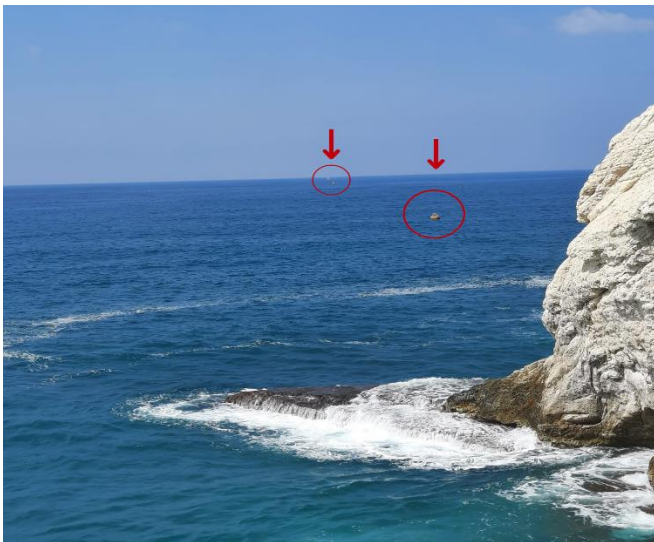
• תחילת קו המצופים באזור החוף

למעשה, "שטחי המים הכלכליים" -במובן המילולי של המלה- כלומר שטחי ה"מים" עצמם הנם הצד הפחות רלבנטי ומהותי בהסכם מול לבנון. שכן, כידוע, הפקות הגז הטבעי אינן מבוצעות מתוך ה"מים" כי אם מתוך שטחי הקרקע והתת קרקע – לשם מוחדרים מתקני הקידוח- וההסכם עצמו עוסק בחלוקת השטחים שבמחלוקת ובחלוקת השווי הכלכלי של הגז שיופק מהמאגר/י הגז הטבעי המצויים בין המדינות. כאשר, לכאורה, שטחי הקרקע והתת קרקע הנם לכאורה "שטח מדינת ישראל"- על פי הוראות חוק השטחים התת ימיים.