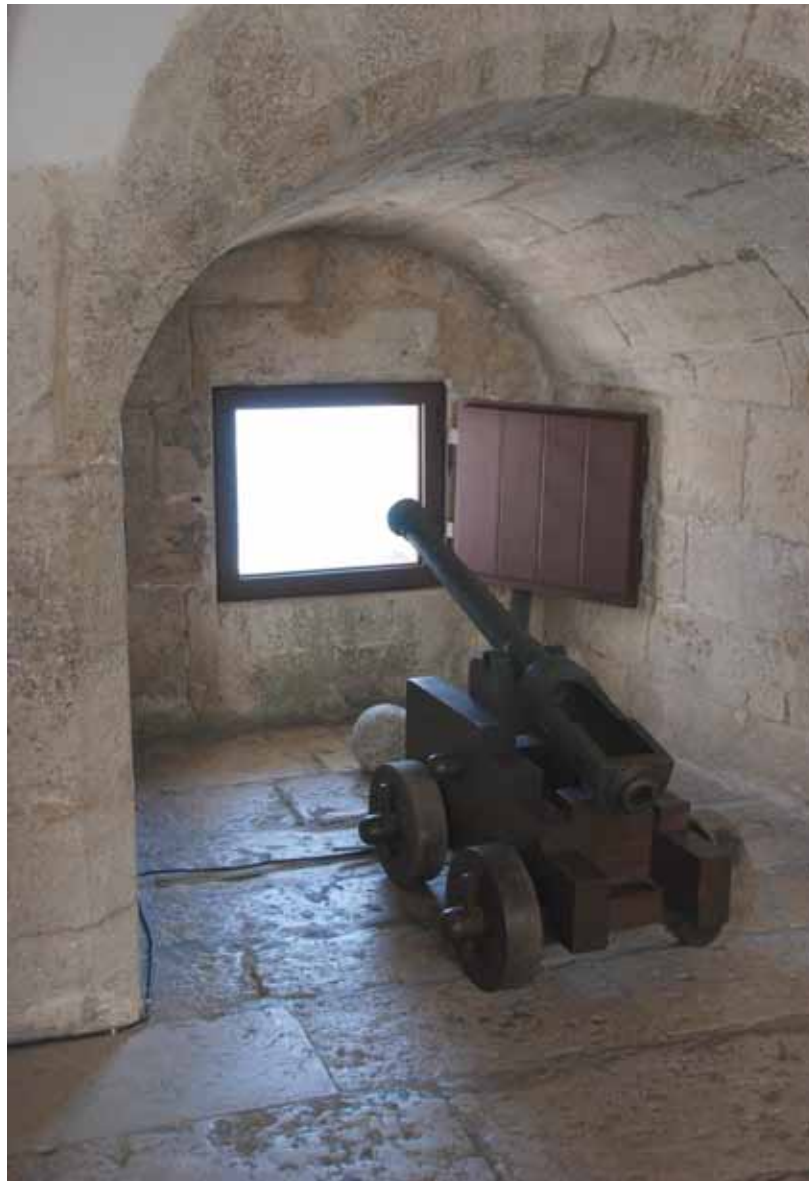
תחום המים הטריטוריאליים נקבע היסטורית לפי "טווח התותח", 12 מיילים ימיים

◀ טריטוריאלי של מדינת החוף, אולם אף הוא כפוף לזכות המעבר התמים של כלי שיט זרים. הרצועה הבאה - 12 המיילים הימיים הבאים (ועד 24 מיילים מקו החוף) - מכונה "אזור ההמשך", ובה נתונה למדינת החוף הרשות לאכוף את סמכויותיה בתחומים כגון מכס, מיסוי, איכות סביבה ותברואה, ואילו האזור הנמתח לפחות עד 200 מייל ימי מקו החוף נחשב "האזור הכלכלי המיוחד", ובו נתונה למדינת החוף הרשות לפתח את משאבי הים ומחצביו. אם המבנה הגיאולוגי של המדף היבשתי נמתח מעבר לקו זה, יכולה מדינת החוף לטעון להרחבת זכויותיה במשאבי הים לפי מבנה המדף עד לטווח מרבי של 350 מייל מקו החוף.